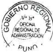
CUADRO N° 001 BIENES PARA ACEPTACIÓN DE DONACIÓN ANEXO DE LA RESOLUCIÓN JEFATURAL N° 090-2015-PARSALUD II PUNO DESS SAN ROMÁN U.E. SIAG =917