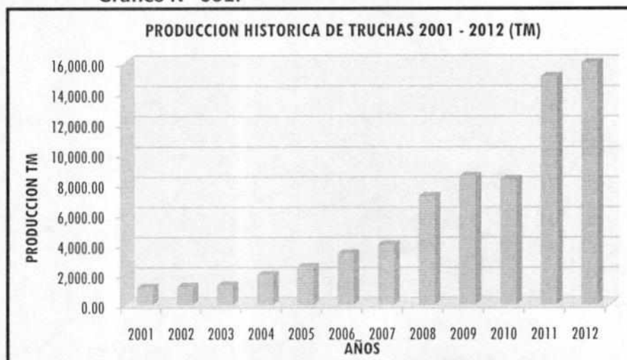
Gráfico N° 001:

NOTA: Se ha tomado en cuenta la observación sobre los datos estadísticos de la producción de trucha que no conversa con los del Compendio Estadístico del Perú 2012, sin embargo los que los mostramos en el presente cuadro N° 12, es ratificado y sustentado por la Dirección de Acuicultura e Investigación de la institución.